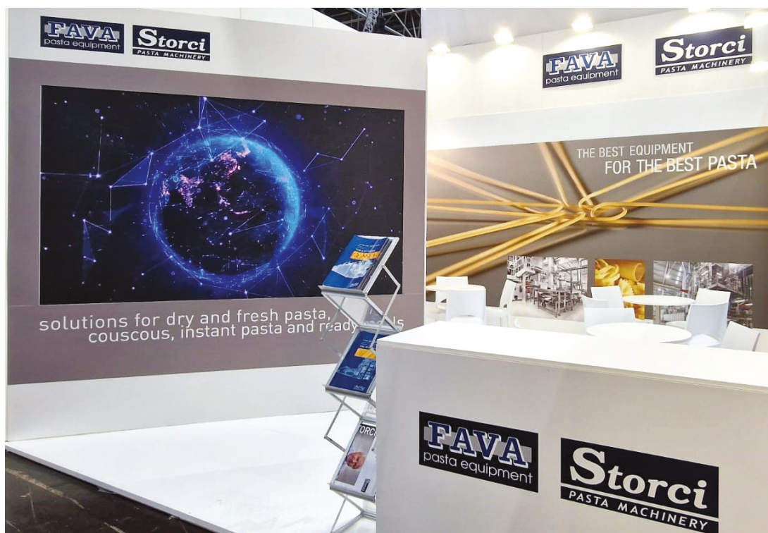
Il meeting point Fava-Storci.

conservazione delle risorse, tecnologia digitale e qualità dei prodotti del settore pasta. Soluzioni che permettono di valorizzare la materia prima attraverso processi tecnologici unici, che facilitano la produzione e il controllo dei parametri utilizzati, come le tecnologie legate a Industry 4.0, in particolare lo IIoT (Industrial Internet of Things), progettato per massimizzare i servizi a valore aggiunto, quali realtà aumentata, strumenti predittivi basati sull'intelligenza artificiale e il machine learning .