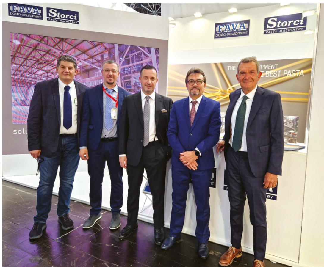
Lo staff Fava e Storci ad Interpack.

I clienti in visita hanno posto particolare attenzione a due soluzioni. La prima è il pacchetto legato alla manutenzione dei componenti critici che, attraverso l'utilizzo di sensoristica intelligente, fornisce all'utilizzatore indicazioni in tempo reale sulle iniziative di manutenzione predittiva, consentendo di minimizzare scarti e fermi macchina imprevisti. La seconda inerente alla qualità del prodotto, attraverso l'implementazione di sensori specialistici e sistemi di visione