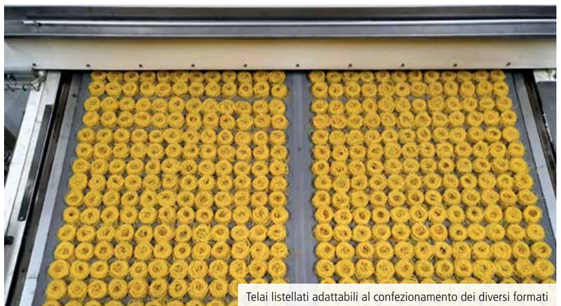
Telai listellati adattabili al confezionamento dei diversi formati