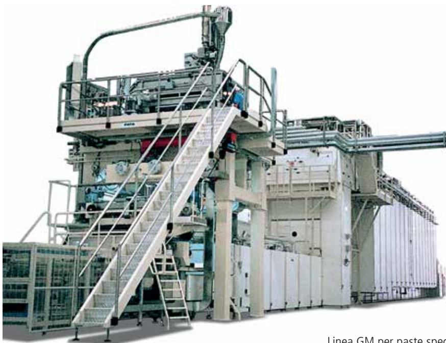
Linea GM per paste speciali

Innovazione importante è stata realizzata nella parte iniziale di preincarto in cui la pasta viene trattata ad alta temperatura con una ventilazione particolarmente efficiente seguita da un trabatto qualora sia prevista la produzione di formati bucati come cannelloni o conchiglioni. Dopo il tradizionale incartamento verticale, ottimizzato negli anni nella meccanica e potenziato nella ventilazione, i telai entrano nell'essiccatoio a più piani il cui sviluppo longitudinale produce un'enorme superficie disponibile. Nessun altro essiccatoio è in grado di restituire a parità di dimensioni altrettanta superficie utile alla quale poter applicare anche formati a bassissimo peso unitario. L'uniformità di trattamento termico è garantita dal fatto che tutti i telai attraversano gli stessi punti di ventilazione. La parte finale del ciclo è dedicata