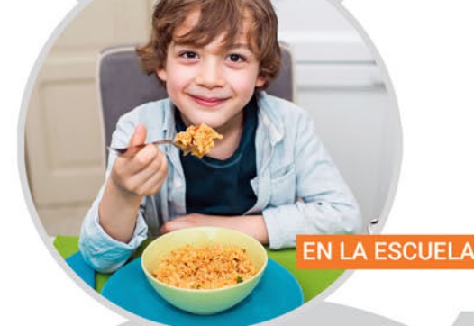
EN LA ESCUELA