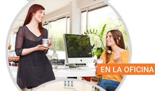
EN LA OFICINA