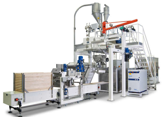
Linea speciale per nidi, lasagne, paste corte e speciali