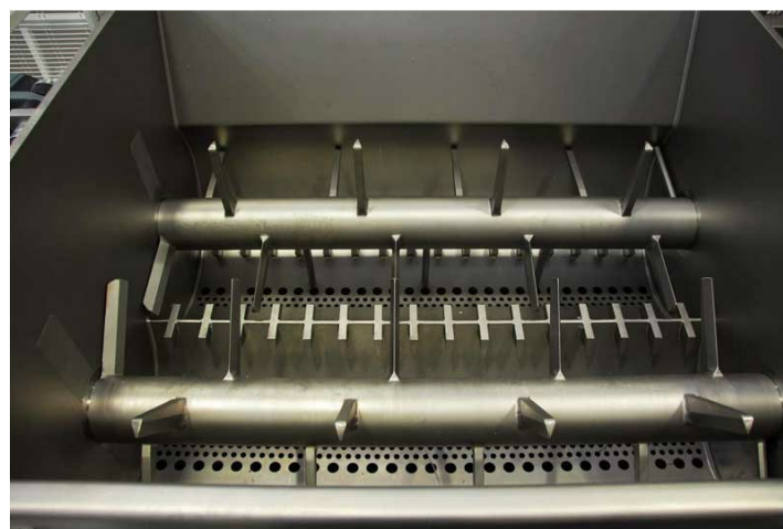
Doble eje de la tina