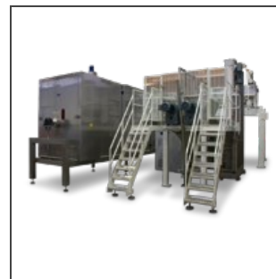
Rec 2000/D AUT