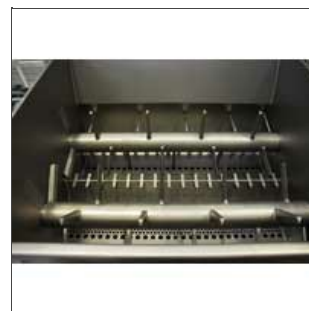
Doble eje de la tina