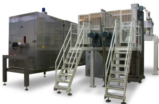
REC 2000 D/AUT