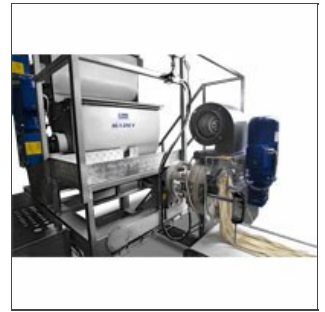
Prensa V90-250 G