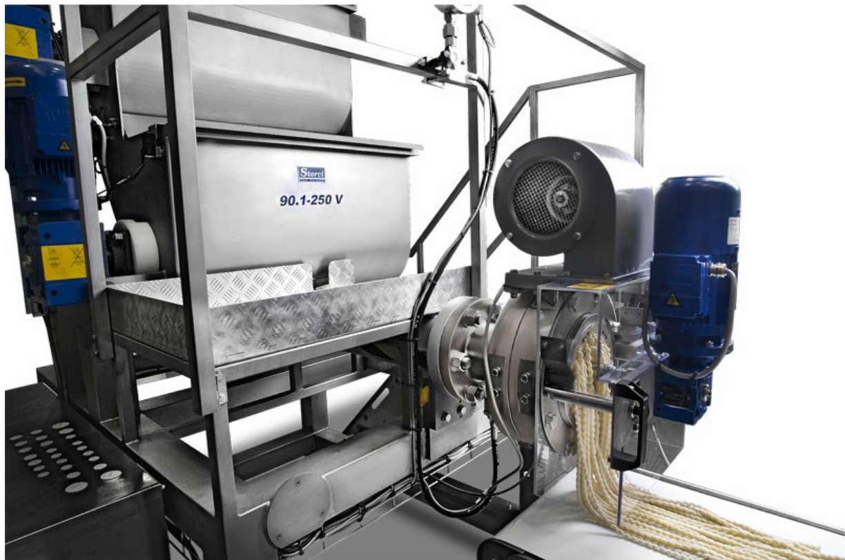
Detalle prensa V90-250 G