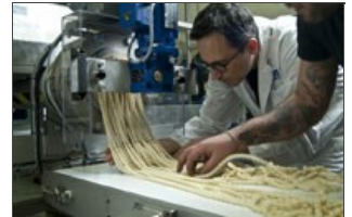
Detalle producción busiata