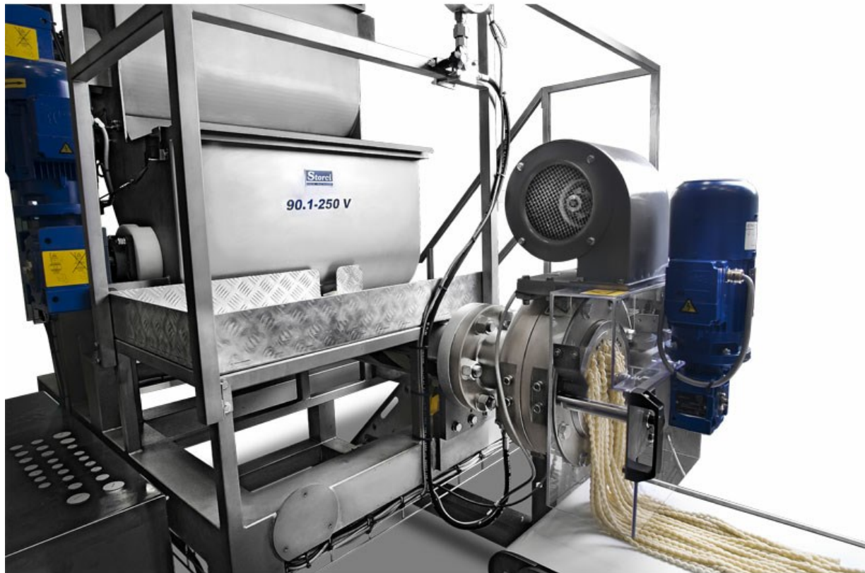
■ Dettaglio pressa V90-250 G