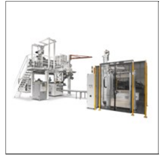
Presse 180.1 sur Ligne pâtes courtes