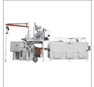
Longdryer para línea de pasta larga