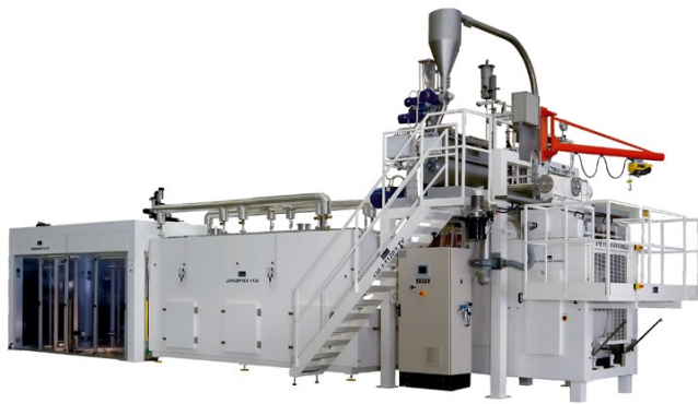
■ Longdryer para línea de pasta larga