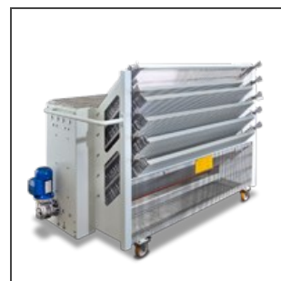
Réservoir pour l'alimentation des cannes