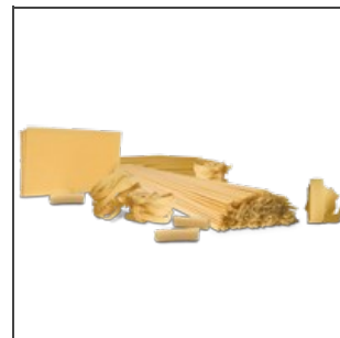
Essiccazione tutti i formati di pasta