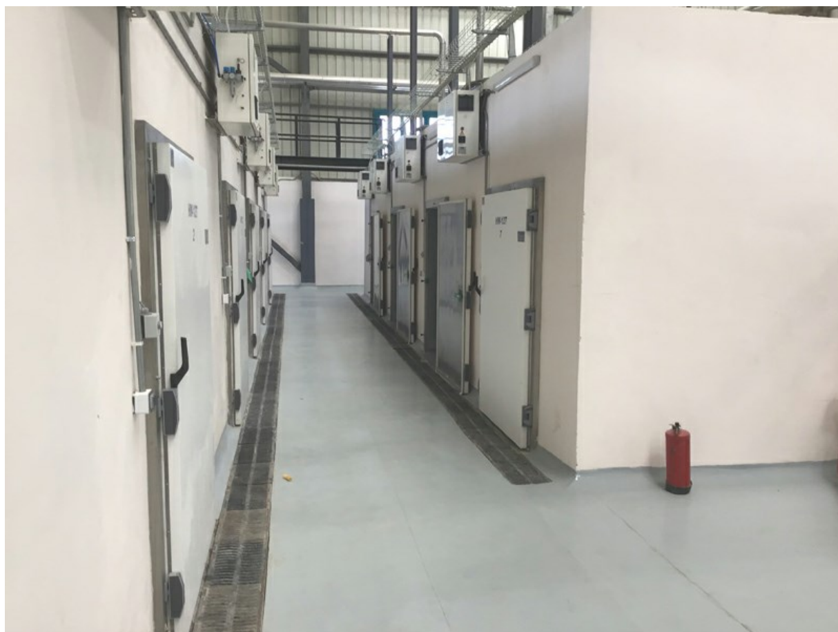
Kits de celdas de secado