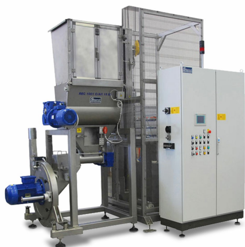
REC 1001 C/A/I