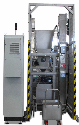
Sistema carico vagonetti