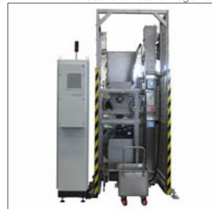
Sistema di carico vagonetti