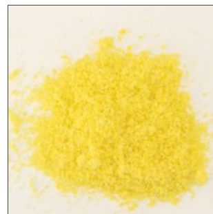
Prodotto triturato omogeneo