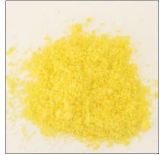
Prodotto triturato omogeneo