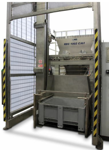
REC 1002 C/A/I