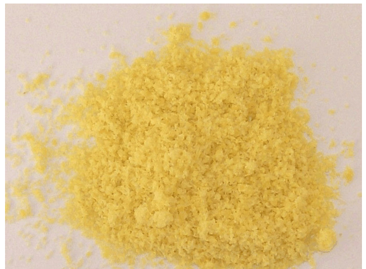
Prodotto triturato omogeneo