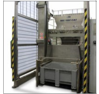
REC 1002 C/A/I