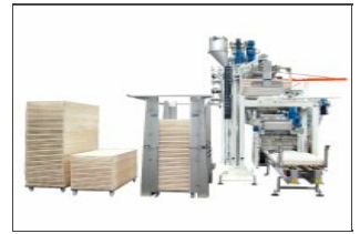
Déempileur de plateaux Robo XD