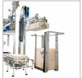
Empileur de plateaux Robo-XI