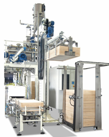
Empileur de plateaux Robo-XI