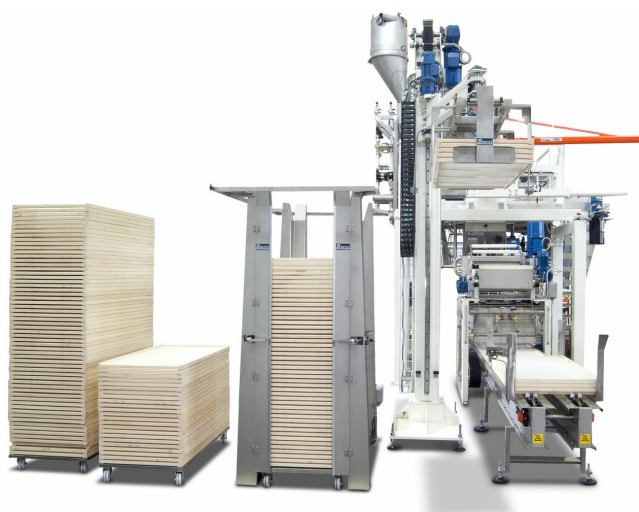
Déempileur de plateaux Robo XD