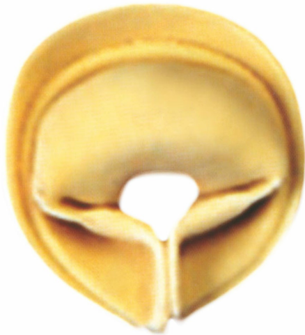
■ Cappelletto pinzato