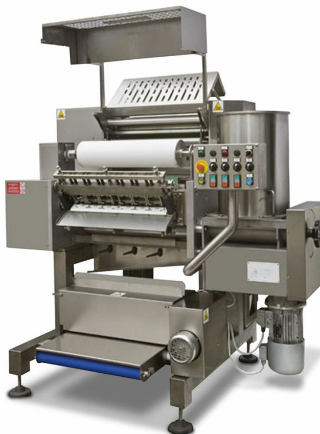
Raviolatrice R 540 C