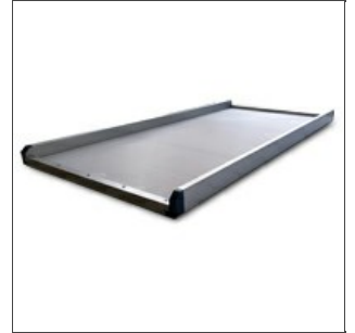
Plateau en aluminium