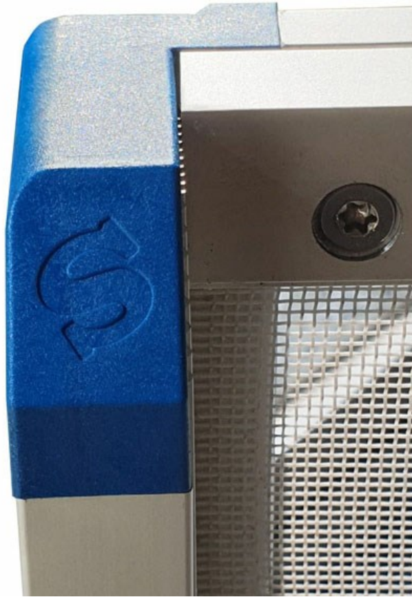
■ Plateaux en aluminium - détail