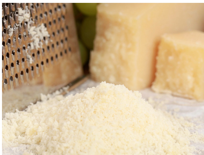
■ Parmigiano Reggiano

Grazie alla recente collaborazione con la società BS di Parmasono nate soluzioni innovative e creative per la preparazione di lasagne e cannelloni pronti per il consumo. Da oltre 30 anni BS opera con competenza e affidabilità nei principali mercati dei piatti pronti, fast food, gelati e dolciumi. Sono questi i prodotti a valore aggiunto che ti permettono di guadagnare e noi ti offriamo la soluzione personalizzata migliore.