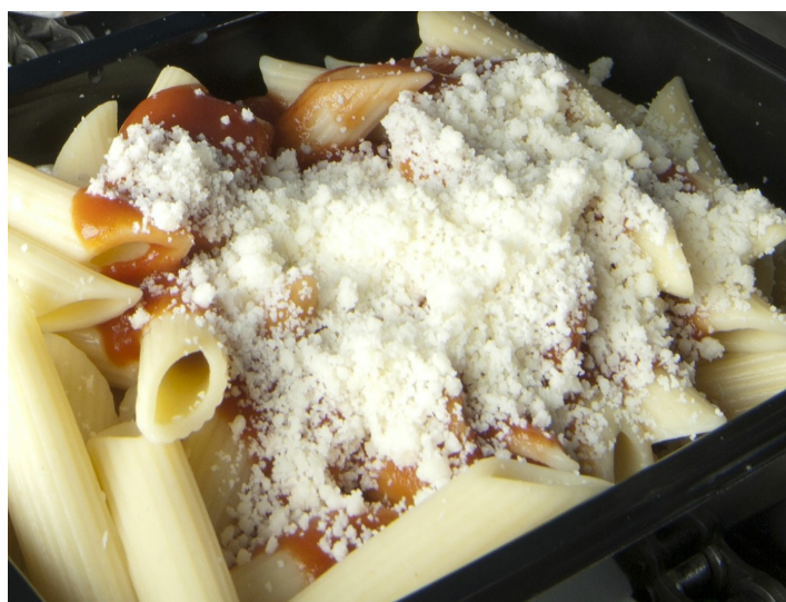
■ Formaggio grattugiato su pasta