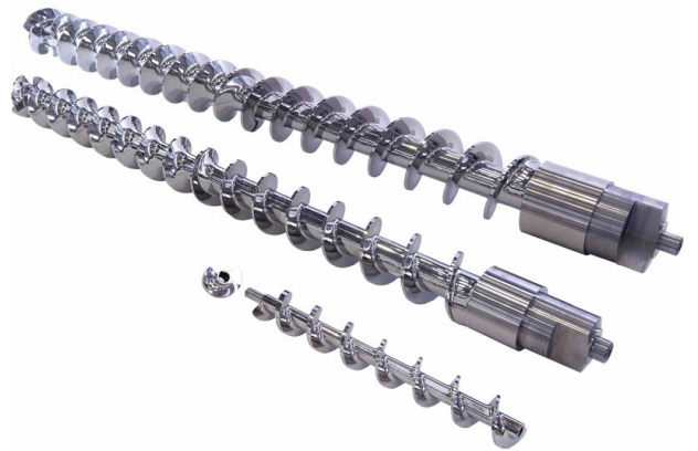
■ Viti di compressione