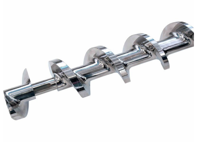
■ Vite di compressione chiusa