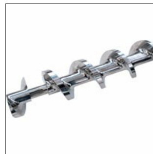
Dettaglio vite di compressione chiusa