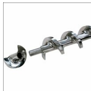
Dettaglio vite di compressione aperta

Abbiamo acquisito una mappa conoscitiva e un conseguente, profondo, patrimonio storico di queste macchine; tutto ciò ci permette di apportare dove necessario migliorie tecnologiche di alto livello e di poter affermare che la parola Braibanti è sempre, grazie anche a noi, sinonimo di indistruttibilità.