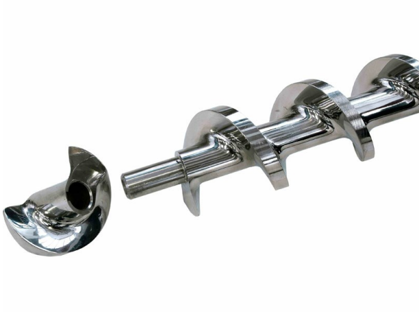
■ Vite di compressione aperta