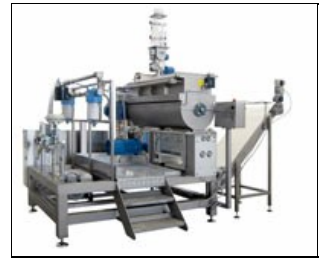
VSF TV/MIX avec système automatique pour pâte