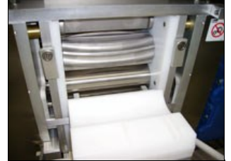
Système de malaxage et calibrage