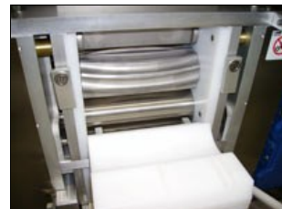
Sistema di gramolazione e calibrazione