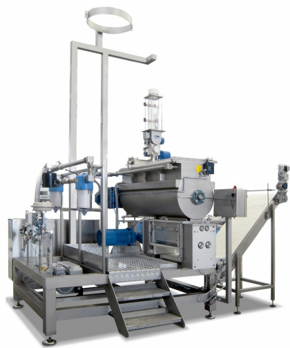
VSF TV/MIX con sistema automatico impasto