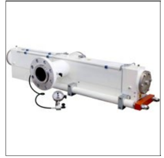
Cabezal para pasta larga

Realizamos revisiones a nuevo de cabezales/tubos difusores usados, en nuestro taller, en particular para los equipos Braibanti, que conocemos de hace más de treinta años y respecto de los cuales podemos brindar un servicio muy válido de asistencia y revisión, gracias a la aplicación de una tecnología más reciente.