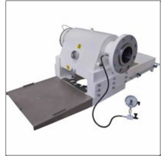
Cabezal para pasta corta