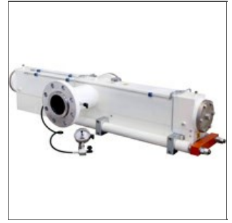
Testata per pasta lunga

Realizziamo revisioni a nuovo di testate/tubi diffusori usati, presso la nostra officina, in particolare per gli impianti Braibanti , che conosciamo da più di trent'anni e rispetto ai quali possiamo fornire un validissimo servizio di assistenza e revisione , grazie all'applicazione di una tecnologia più recente.