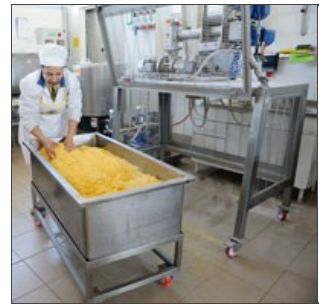
Tanque sobre ruedas y masa