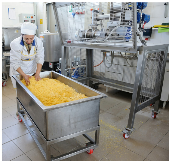
Vasca carrellata con impasto