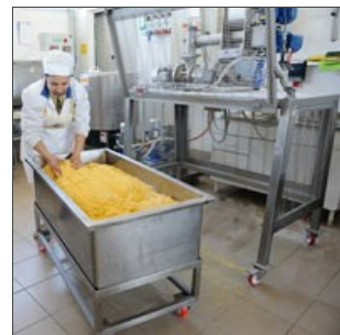
Vasca carrellata con impasto