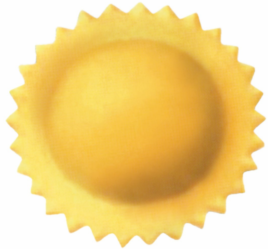
■ Raviolo tondo a doppia sfoglia