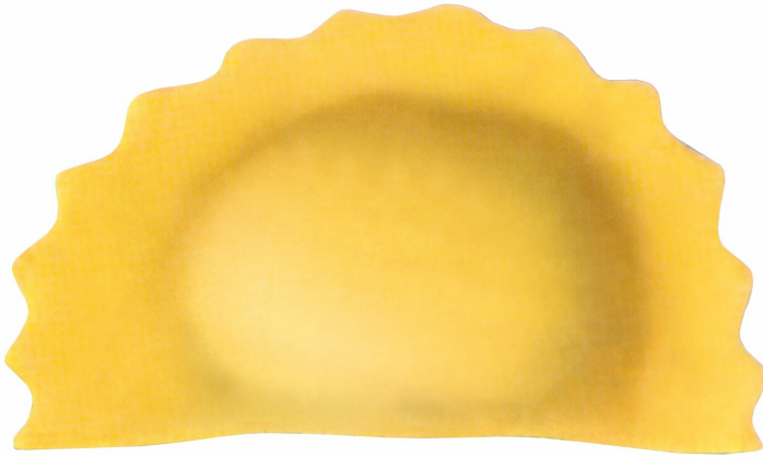
■ Mezzaluna a doppia sfoglia