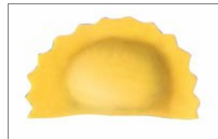
Mezzaluna a doppia sfoglia

Dispositivo di taglio e/o recupero sfridi; regolazione elettronica indipendente della velocità sfoglia.